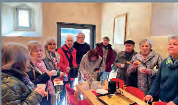
Sehlem - Kaffeetrinken nach Gottesdienst