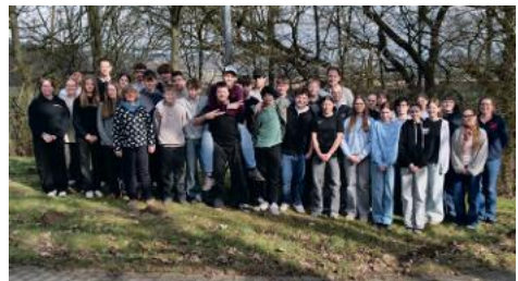
Konfirmandinnen und Konfirmanden aus den Pfarrbezirken Bad Salzdetfurth, Bodenburg und Innerstetal waren Ende Februar auf regionaler Konferfahrt im Naturfreundehaus Ith in Lauenstein.