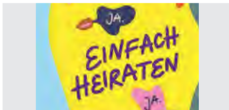
EMA | Hannover und www.kristinawedel.de