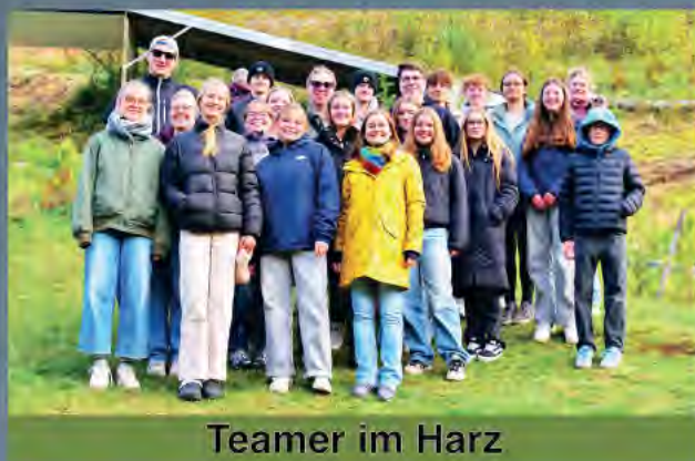
Teamer im Harz

Es werden noch Kuchenspenden zum Pfungstchristival benötigt