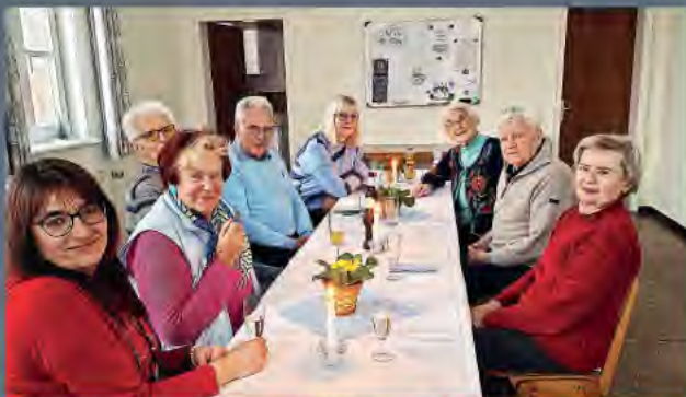
Breinum - gemütliches Kaffeetrinken