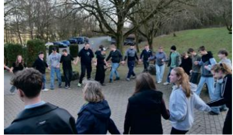
Gemeinsam in Bewegung beim englischen Folkorettanz „Fröhlicher Kreis“ (Circassian Circle).