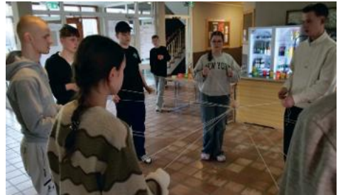
Auf der regionalen Konferfahrt in Lauenstein gab es viele Spiele und Gemeinschaftsaktivitäten.